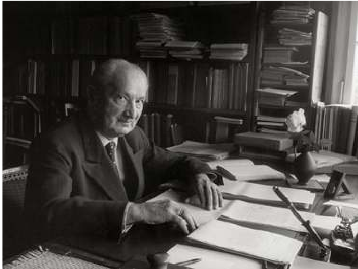
Heidegger schrijft in 1946 een "Brief über den Humanismus"