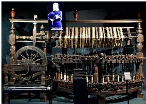
Twijnmolen, beschermd door het topstukkendecreet

Na een grondige renovatie en herinrichting is het niet te verwonderen dat de collectie machines voor de textielindustrie een belangrijke plaats in nemen. Daaraan had Gent immers vanaf de middeleeuwen zijn grote bloei te danken. Ook de machines zoals in gebruik in drukkerijen door de eeuwen heen zijn heel goed vertegenwoordigd.