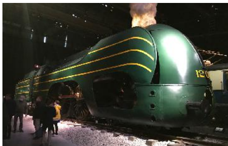
de spectaculaire stoomlocomotief Type 12