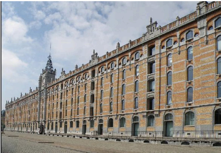
Buitenaanzicht van het Koninklijk Pakhuis

zijn gerenoveerd en zoveel mogelijk in zijn oorspronkelijke staat behouden gebleven maar state-of-the-art geschikt gemaakt voor gebruik door winkels, bedrijven en horeca in het betere segment. Met onze gidsen hadden wij de exclusieve mogelijkheid ook het dak en het theater te betreden.