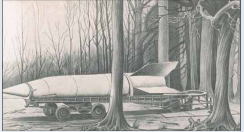
Wapens voor massavernietiging: illustratie op de introductiepagina van "Ballistics of the Future", met een motto van Shakespeare.