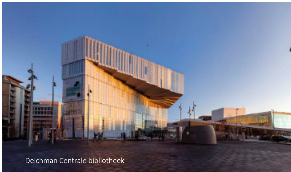
Deichman Centrale bibliotheek