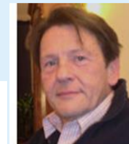
Pier Manger Cats