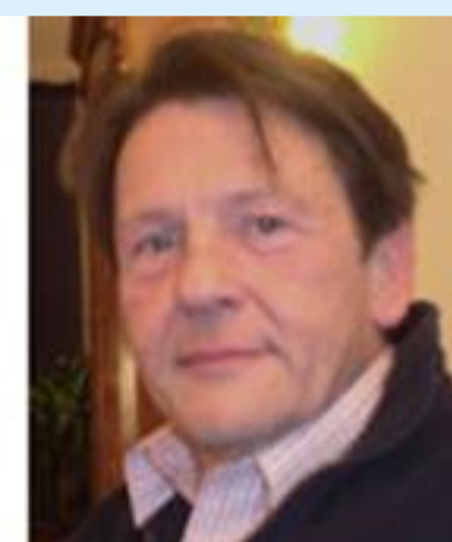
Pier Manger Cats